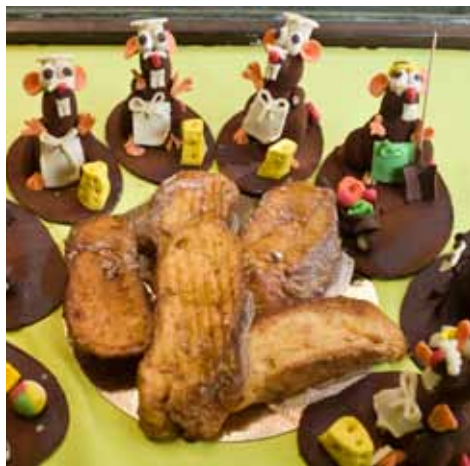
Torrijas y figuritas de chocolate y mazapán. French toast and chocolate and marzipan figures