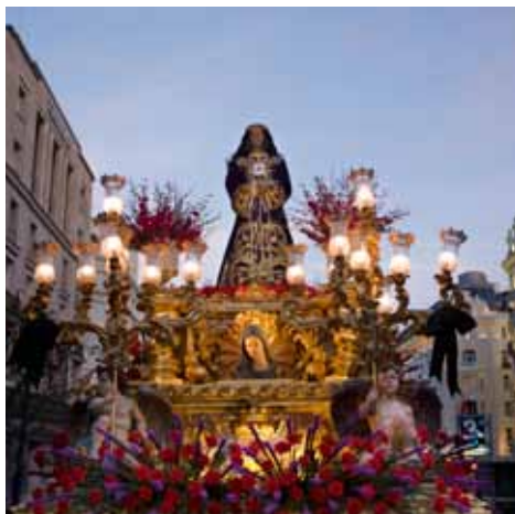
Procesión / Procession Nuestro Padre Jesús Nazareno de Medinaceli